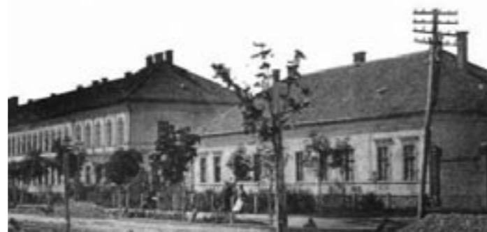
Žrebčinec zo Štefánikovej ulice